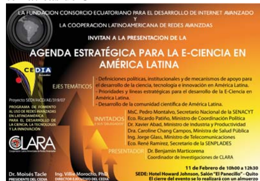
Ilustración 2 Invitación a la presentación de la Agenda Estratégica de e-Ciencia en América Latina

Estas redes temáticas serían convocadas para la asistencia al evento que se llevaría a cabo el 12 de Febrero.