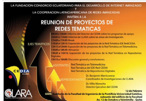
Ilustración 1 Invitación a Workshop de redes temáticas de CEDIA