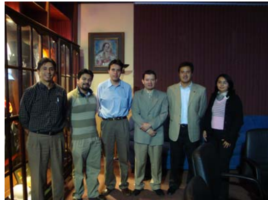
Ilustración 2 Sesión de Inmersión a las Redes Avanzadas en la UPS Cuenca

En la UPS Cuenca se llevó a cabo dos sesiones de inmersión a las Redes Avanzadas. El primero fue programado por la Red Avanzada del Perú, cuyo propósito fue integrar a estudiantes de secundaria por medio de videoconferencias en grupos de interés alrededor de la Robótica