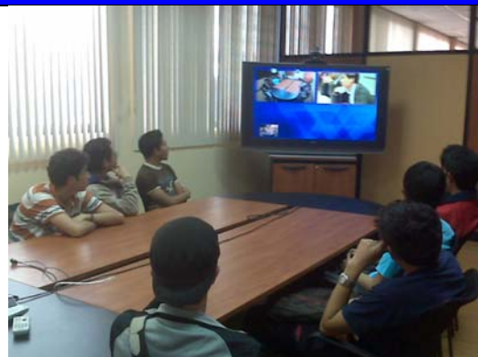
Ilustración 1 Estudiantes de Secundaria en la UPS Cuenca, grupo de interés en Robótica

En la UPS Cuenca se llevó a cabo dos sesiones de inmersión a las Redes Avanzadas. El primero fue programado por la Red Avanzada del Perú, cuyo propósito fue integrar a estudiantes de secundaria por medio de videoconferencias en grupos de interés alrededor de la Robótica